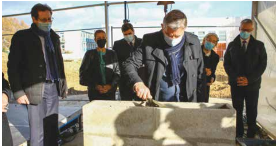
Pose de la première pierre de l'atelier de remanufacturing «Single Roof» d'Air France Industries, en novembre dernier.

« A l'occasion de l'extension de notre activité moteur », précise-t-il, « nous nous sommes engagés avec la Région, l'État et Grand-Orly Seine Bièvre pour créer une filière permettant aux jeunes d'accéder à ces métiers passionnants et plutôt bien rémunérés. A cet effet, nous travaillons avec les acteurs locaux de l'emploi pour mettre en oeuvre un sas d'entrée vers ces projets ».