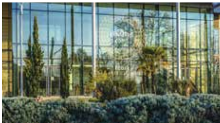
L'École Lenôtre, un nouvel acteur qui rejoint la dynamique «Rungis Académie» en faveur de la filière agroalimentaire.

L'une des principales idées que nous avons pu mettre en oeuvre a été de créer des passerelles : un jeune de 20 ans ne sait pas forcément ce qu'il veut faire. C'est pourquoi, il est important d'avoir une