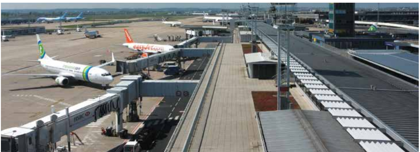
Vers la création d'une filière des métiers de l'aérien et de l'aéroportuaire permettant aux jeunes d'accéder à des métiers passionnants.

De plus, il existe un service appui RH que l'on a eu l'occasion d'utiliser à plusieurs reprises pour l'embauche d'apprentis ou pour d'autres sujets RH. Enfin on dispose d'un personnel toujours disponible pour nous aider. »