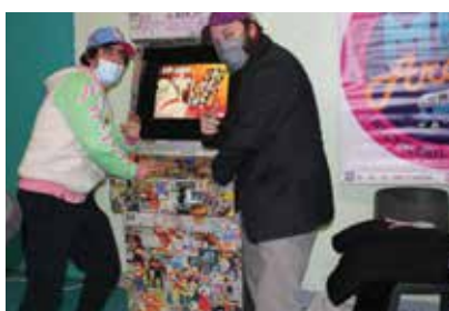
Med Arcade (Viry - Crapo)