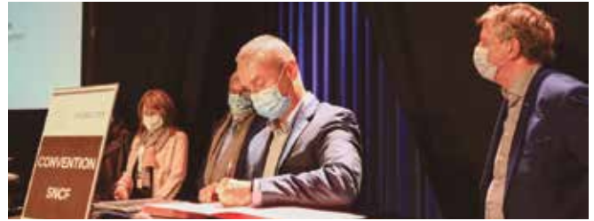
Après la signature de conventions avec la Société du Grand Paris pour les clauses d'insertion dans la réalisation du Grand Paris Express lignes 14 et 15, Grand-Orly Seine Bièvre vient de signer une convention similaire avec la SNCF, à l'occasion de ces 4 e assises