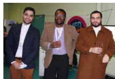
Collab (KB / Viry)