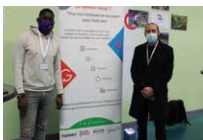
GobUse (Viry Station)