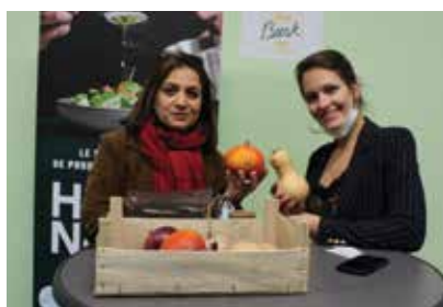
Beesk (Min rungis)

Aujourd'hui plus de 50 acteurs publics et privés ont signé le Manifeste.