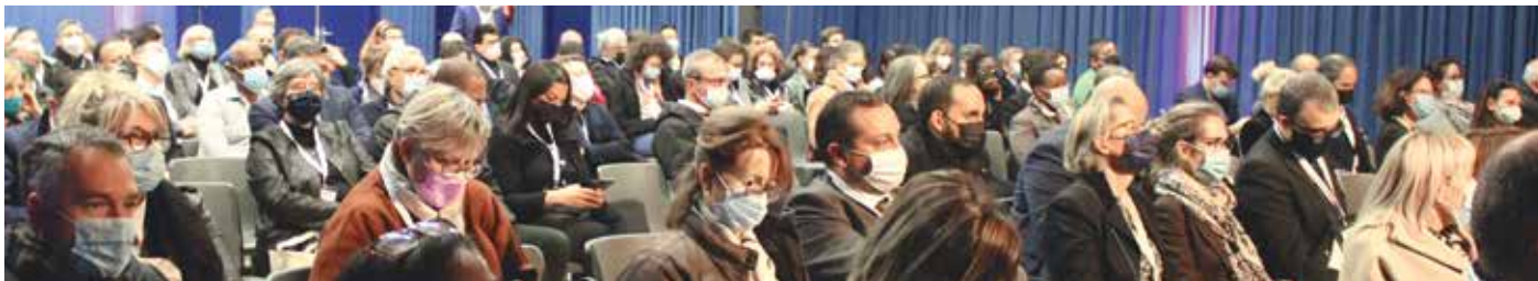
Le 2 décembre 2021 plus de 250 personnes étaient présentes aux 4 e Assises du Développement économique du Grand-Orly Seine Bièvre.