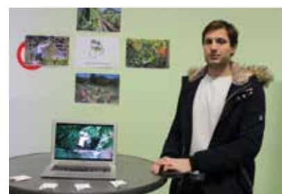
Cultures en Ville (Cachan La Fabrique)