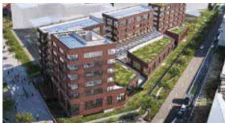
Un Éco-Campus du bâtiment au cœur du Domaine Chérioux à Vitry-sur-Seine.

L'Éco-Campus du bâtiment est un projet né il y a six ans de la volonté de la Fédération Française du Bâtiment et des Chambres Syndicales de l'Électricité, de la Couverture, de la Plomberie, au bénéfice de la formation et porté par les acteurs locaux.