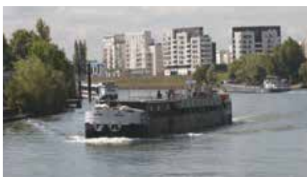
Pourquoi ne pas imaginer de relier le Havre à Rungis en utilisant la Seine ?

■ Quel rôle a pu jouer le Grand-Orly Seine Bièvre pendant la crise sanitaire ?