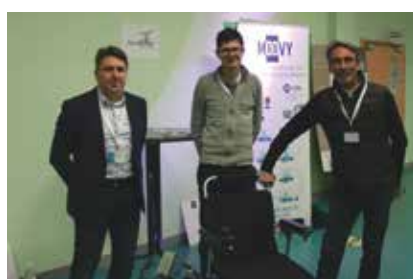
Gyroboost (Ivry - Silver Innov),