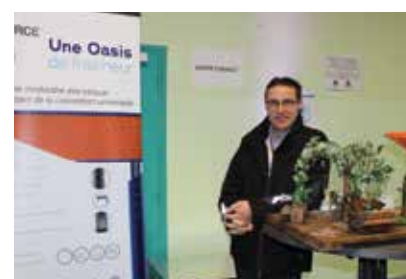
Water Connect (VSG / Valenton)