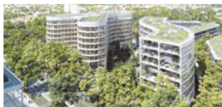
Renforcement de l'offre du Campus Science et Santé à Villejuif avec Sadev 94

Grand-Orly Seine Bièvre : l'ambition d'un grand territoire industriel et productif