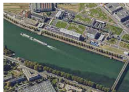
Un campus dédié à la croissance pharmaceutique française sur le site de Sanofi à Vitry-sur-Seine.

Nous aurons 120 modules et très vite nous formerons les opérateurs des membres du consortium des quatre entreprises. Ce campus est donc un facteur essentiel pour le développement de la croissance pharmaceutique en France, mais aussi un facteur essentiel pour la croissance du territoire. »