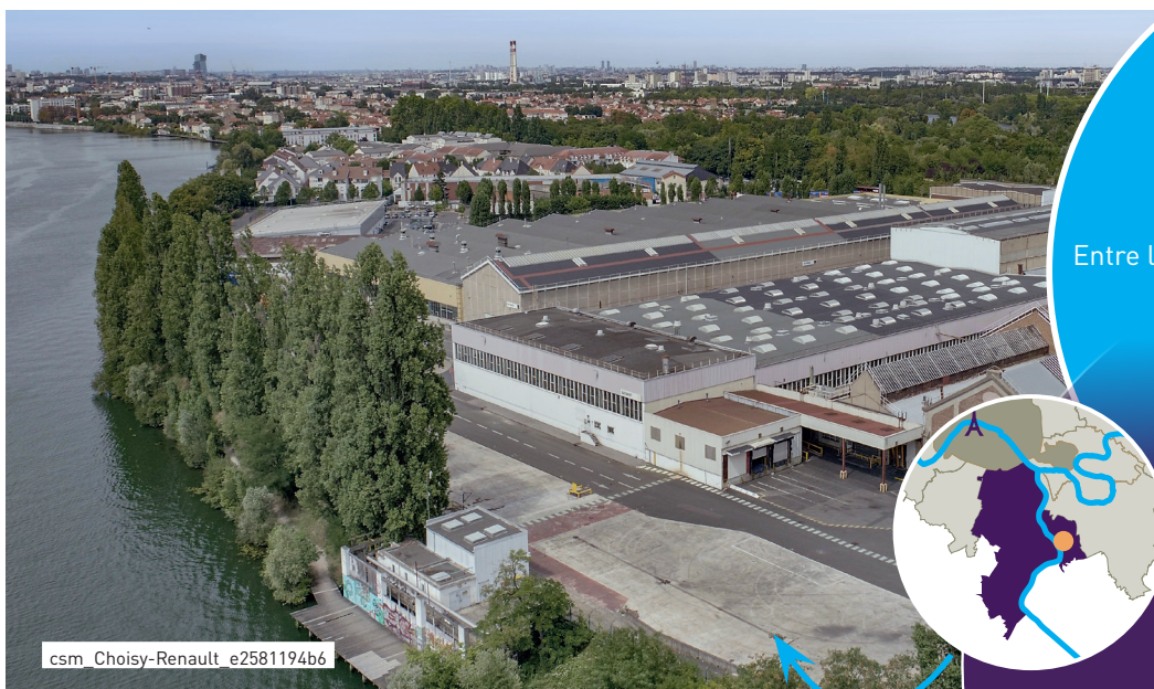
csm Choisy-Renault e2581194b6

CONSTRUITE EN 1933 POUR LA FABRICATION D'AVIONS, L'USINE A ÉTÉ REPRIS PAR LE GROUPE RENAULT EN 1949 POUR LA RÉNOVATION DE MOTEURS ET DE CULASSES. APRÈS EN AVOIR FAIT UN VÉRITABLE PÔLE D'ÉCONOMIE CIRCULAIRE, RENAULT A TRANSFÉRÉ LES ACTIVITÉS SUR LE SITE DE FLINS À L'ÉTÉ 2022. UNE NOUVELLE HISTOIRE INDUSTRIELLE DOIT DÉSORMAIS S'ÉCRIRE DANS LA CONTINUITÉ DES ENJEUX LIÉS À LA TRANSITION ÉCOLOGIQUE. UN PROTOCOLE D'ACCORD QUANT AUX CONDITIONS DE MUTATION DE CE SITE A ÉTÉ SIGNÉ LE 8 FÉVRIER 2024 ENTRE L'ENTREPRISE RENAULT, LES VILLES DE CHOISY-LE-ROI, DE VILLENEUVE-SAINT-GEORGES ET LE GRAND-ORLY SEINE BIÈVRE.