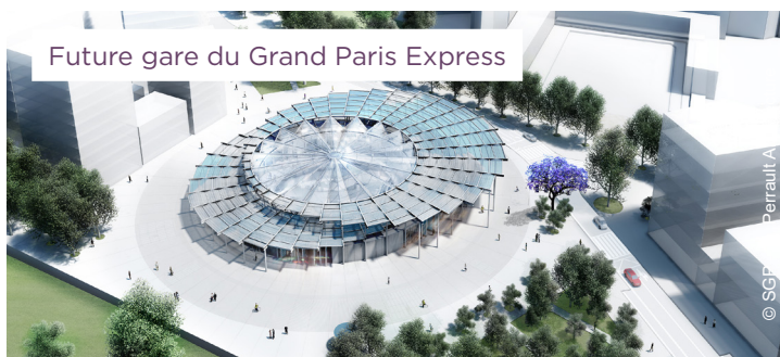
Future gare du Grand Paris Express

Linkcity Île-de-France a été retenu pour la réalisation d'un lot mixte de près de 24 000 m 2 . Il prévoit 7 000 m 2 de laboratoires et bureaux de recherche en biotechnologies avec Orox-Perelis, une résidence hôtelière, des logements diversifiés, un centre sportif, une crèche et un centre médical de proximité. Les travaux ont démarré et la livraison est prévue en 2024.